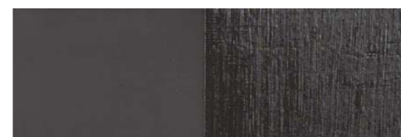
IDROSTUCCO ST381008 WENGÉ / WENGÉ