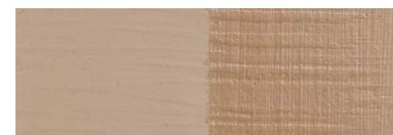
IDROSTUCCO ST381009 NOCE CHIARO / LIGHT WALNUT